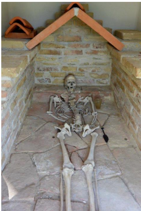
Kép 1. Római kori katona sírja