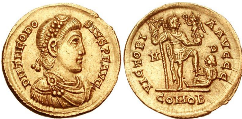
Kép 2. Flavius pénzérmék