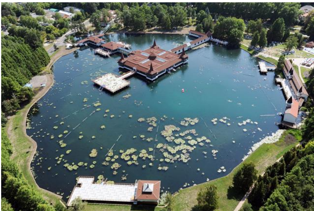
Kép 4. A Hévízi-tó

A Hévízi-tó Természetvédelmi Terület bő 60 ha, melyből a tó területe 4,6 ha-t ölel fel. A természetvédelmi területből fennmaradó 55,4 ha láperdős övezet, illetve a területet járhatóvá tévő útszakasz. A tó és a tavat körülölelő véderdő természeti értékét és egészségre gyakorolt hatását együtt, egymásra hatva érdemes méltatni, hiszen a gyógytónak és a tavat körülvevő láperdőknek együttes hatásaként, sajátos, egyedi mikroklíma érezhető a területen.