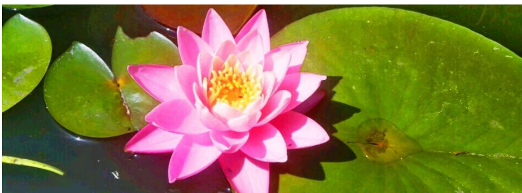
Kép 6. A hévízi tündérrózsa

A Hévízi-tó legközismertebb természeti értéke a tó üde színfoltjait adó hévízi tündérrózsa, mely mára szimbóluma Hévíznek és a Hévízi-tónak.