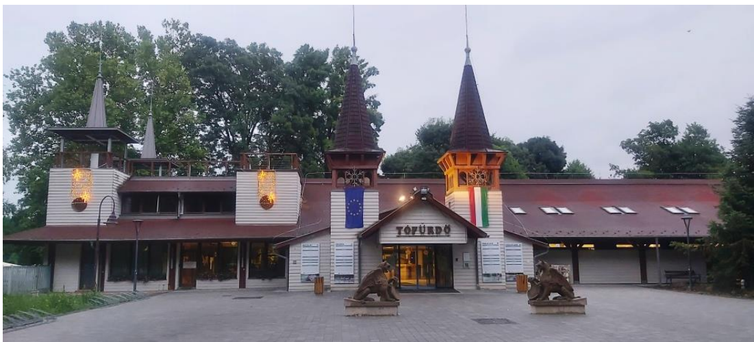
A Hévízi-tófürdő dr. Schulhof Vilmos sétány felőli "kerubos" bejárata 2023.